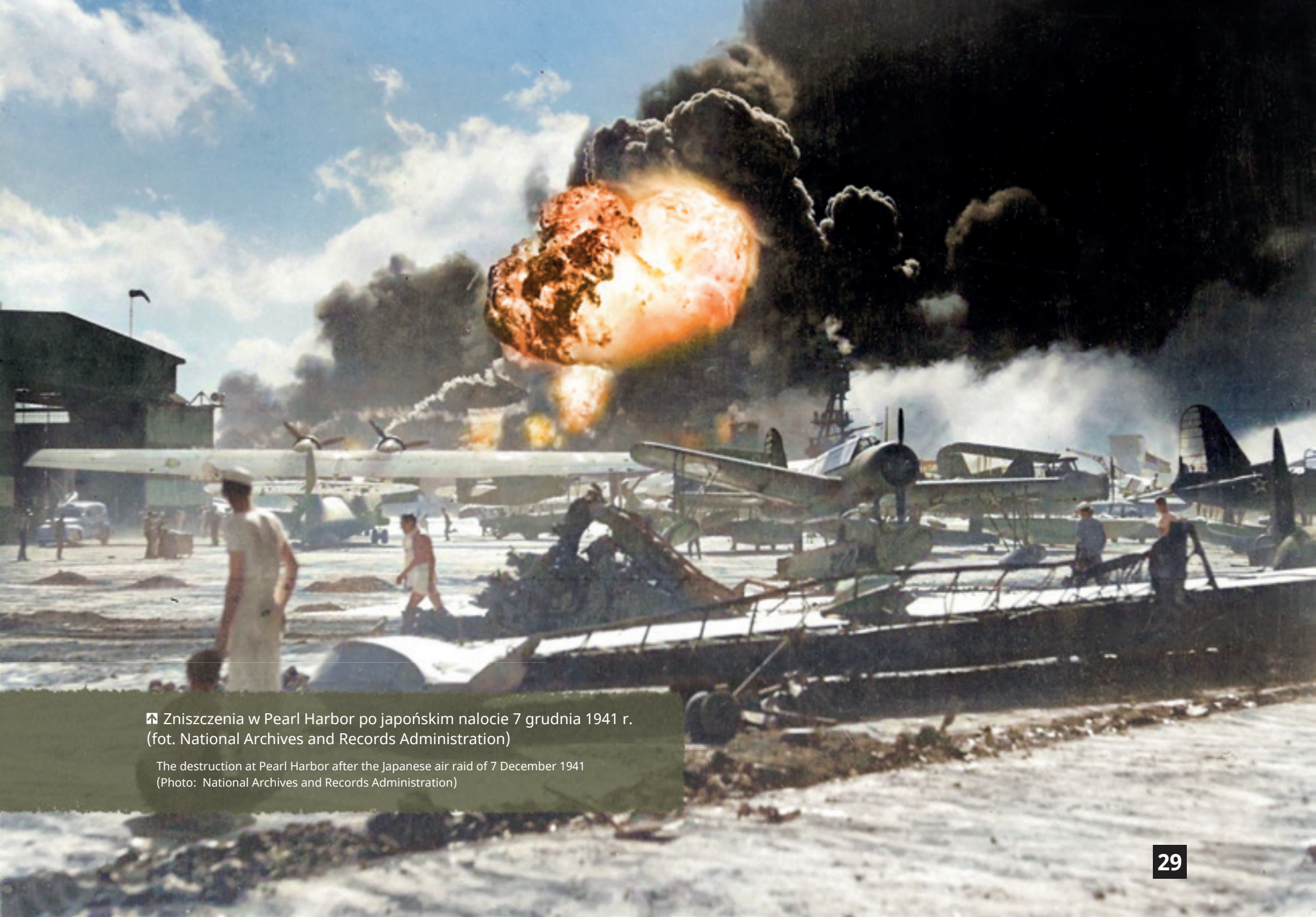
📍 Zniszczenia w Pearl Harbor po japońskim nalocie 7 grudnia 1941 r.

The destruction at Pearl Harbor after the Japanese air raid of 7 December 1941