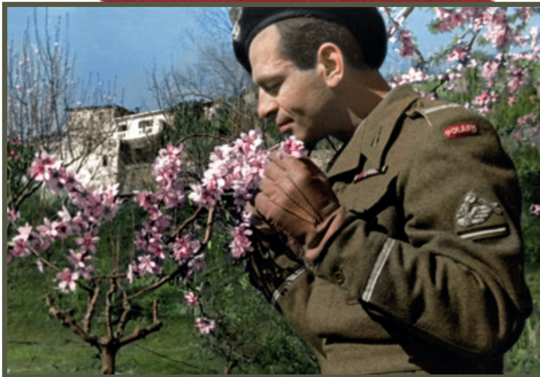
☛ Żołnierz 2. Warszawskiej Dywizji Pancernej przy drzewie jabłoni, 1945–1947

A soldier of the 2nd Warsaw Armoured Division by an apple tree, 1945–47