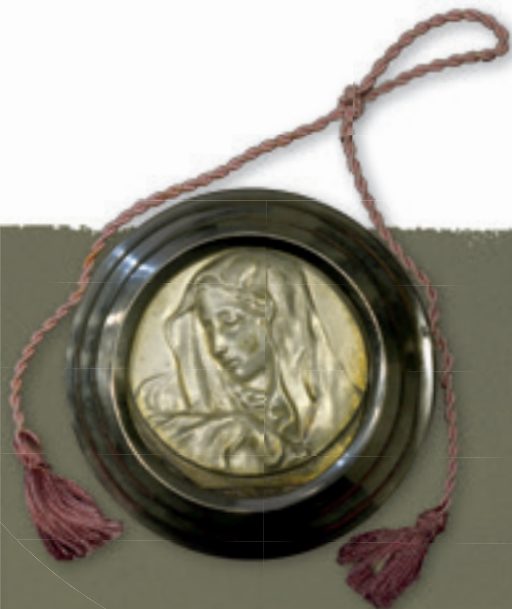
☒ Medalion kpt. ks. Romana Zamka

Medallion of Father Cpt Roman Zamek