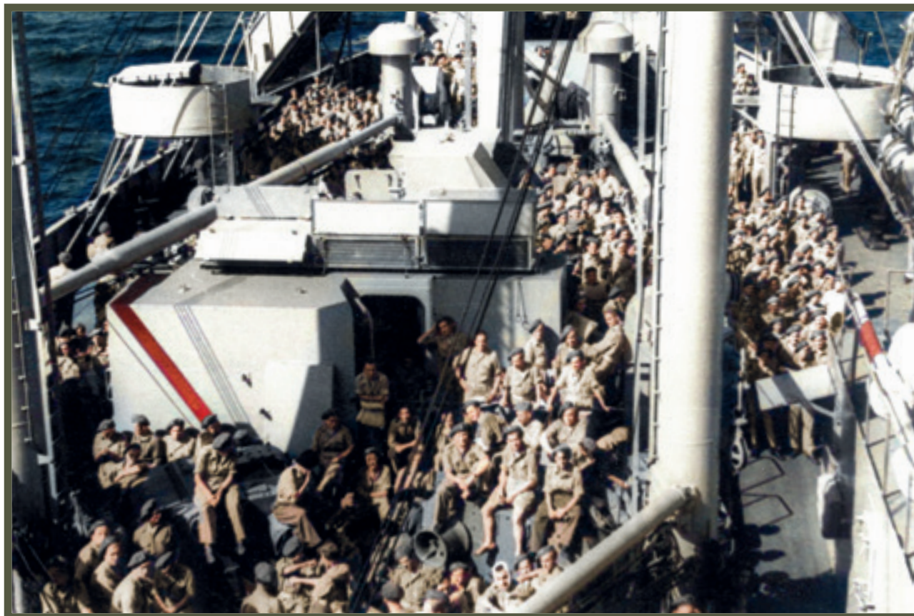
☒ Żołnierze służący w Polskich Siłach Zbrojnych wracają statkiem do Polski, 1946 r.

Soldiers of the Polish Armed Forces on board of a ship, returning to Poland, 1946