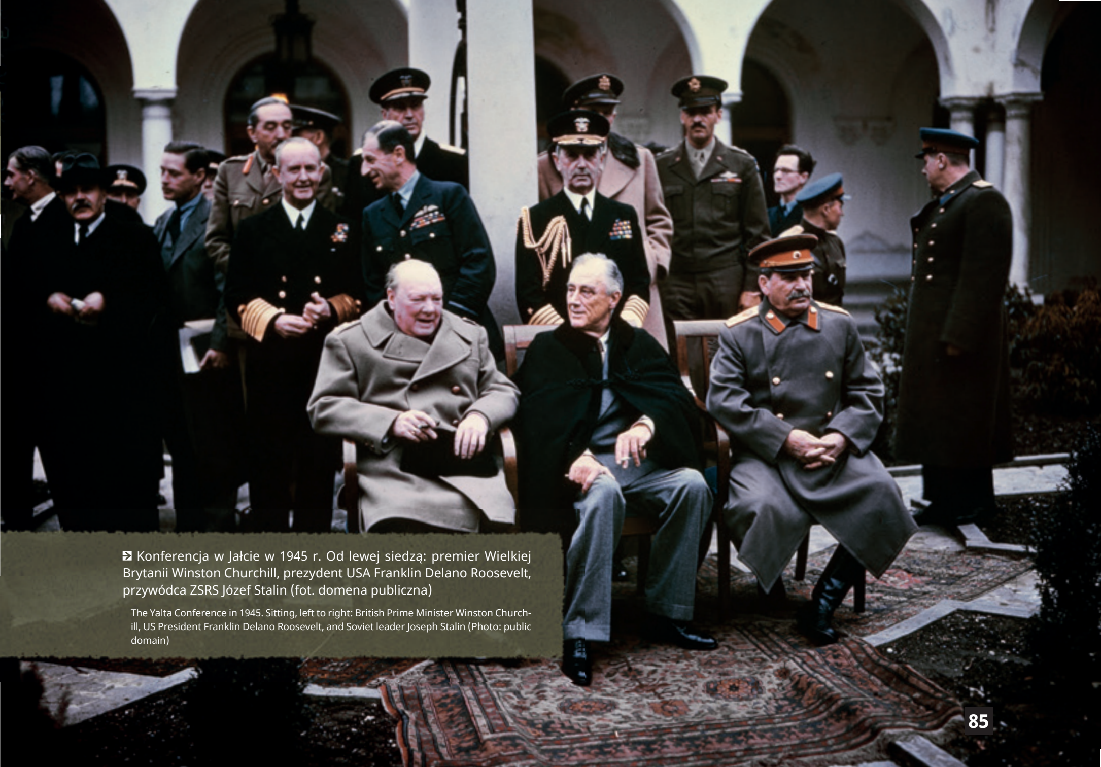
➤ Konferencja w Jałcie w 1945 r. Od lewej siedzą: premier Wielkiej Brytanii Winston Churchill, prezydent USA Franklin Delano Roosevelt, przywódca ZSRS Józef Stalin

The Yalta Conference in 1945. Sitting, left to right: British Prime Minister Winston Churchill, US President Franklin Delano Roosevelt, and Soviet leader Joseph Stalin