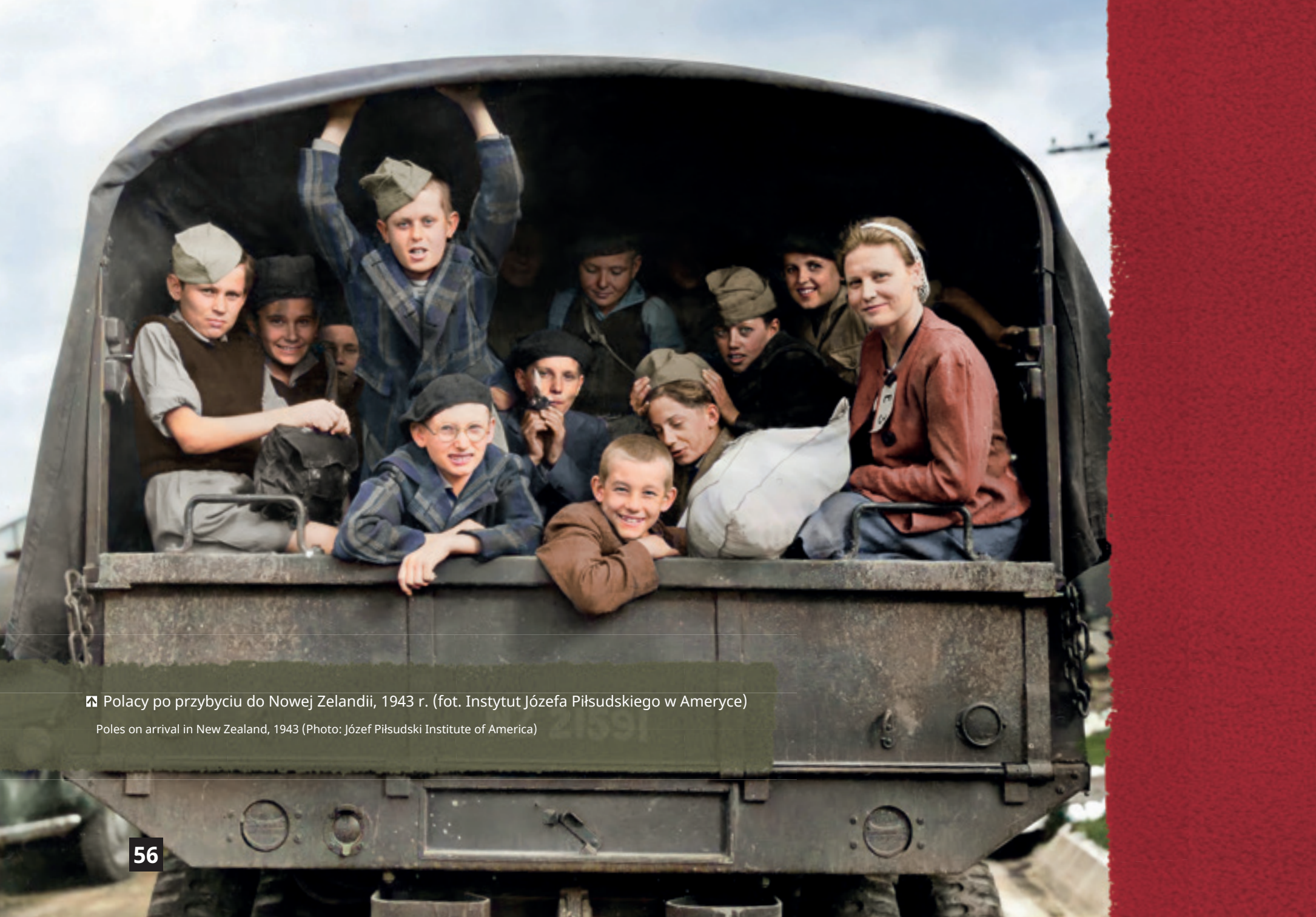
🚩 Polacy po przybyciu do Nowej Zelandii, 1943 r.

Poles on arrival in New Zealand, 1943