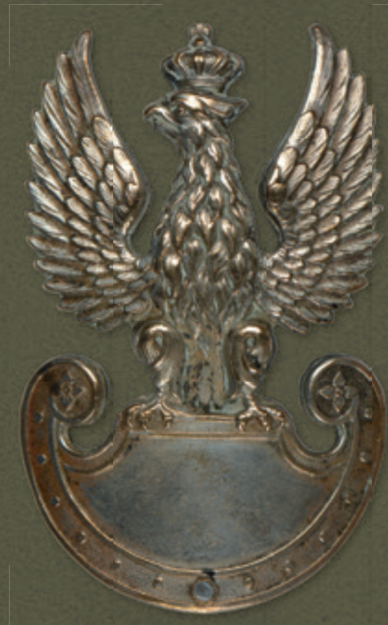
Orzeł wojskowy Polskich Sił Zbrojnych, wzór 1940 r., należący do Tadeusza Starzyńskiego

The eagle of the Polish Armed Forces, model 1940, property of Tadeusz Starzyński