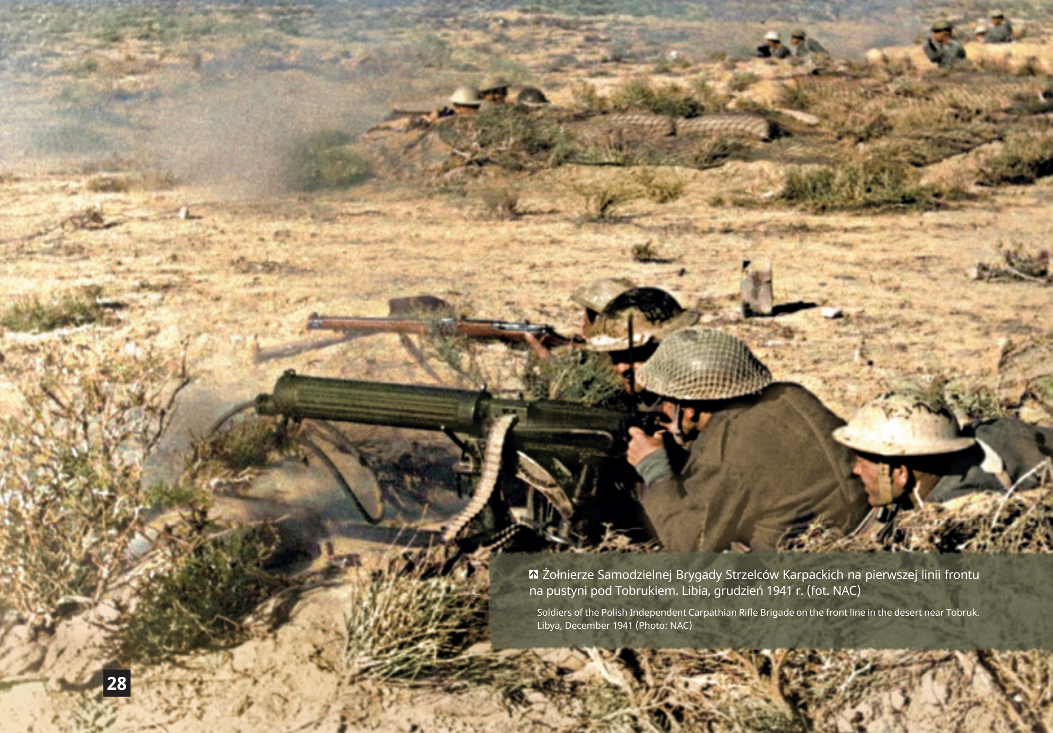
📍 Żołnierze Samodzielnej Brygady Strzelców Karpackich na pierwszej linii frontu na pustyni pod Tobrukiem. Libia, grudzień 1941 r.

Soldiers of the Polish Independent Carpathian Rifle Brigade on the front line in the desert near Tobruk. Libya, December 1941