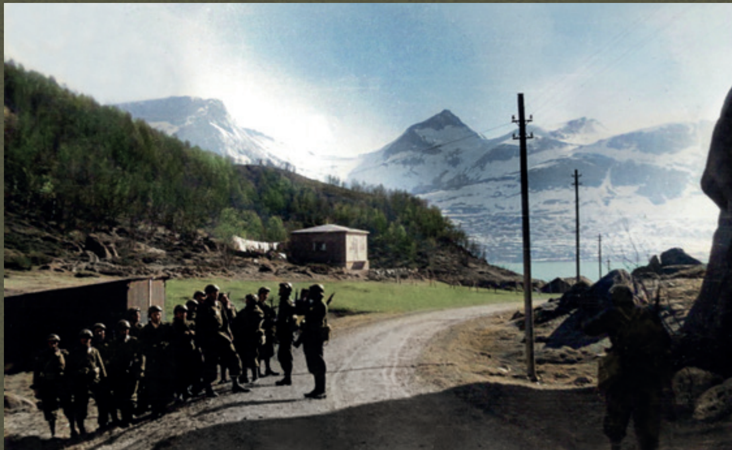
☒ Żołnierze Samodzielnej Brygady Strzelców Podhalańskich w Norwegii, maj 1940 r.

Soldiers of the Polish Independent Highland Brigade in Norway, May 1940